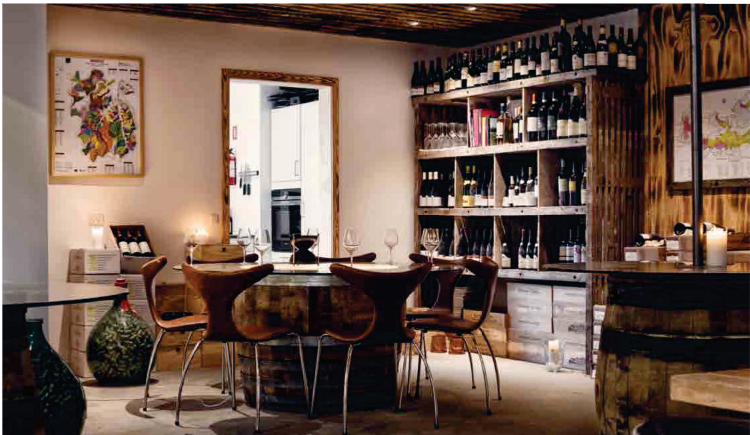
Vintur.dk har ud over traditionelt vinsalg specialiseret sig i vinrejser til Sydeuropa.

ofte sælger vinpartier, som leveres direkte fra vinleverandørerne. Det kræver en vis likviditetsbinding, indtil salget dækker hele investeringen ind." og fortsætter: "Det kræver også tid og yderligere kapital at udforske nye vinområder og opsøge nye producenter. Deruover tager det tid at etablere gode vinrejser samt opnå en fordel ved tilskud og rabatter over for producenterne, indtil jeg har bevist, at deres vine kan sælges".